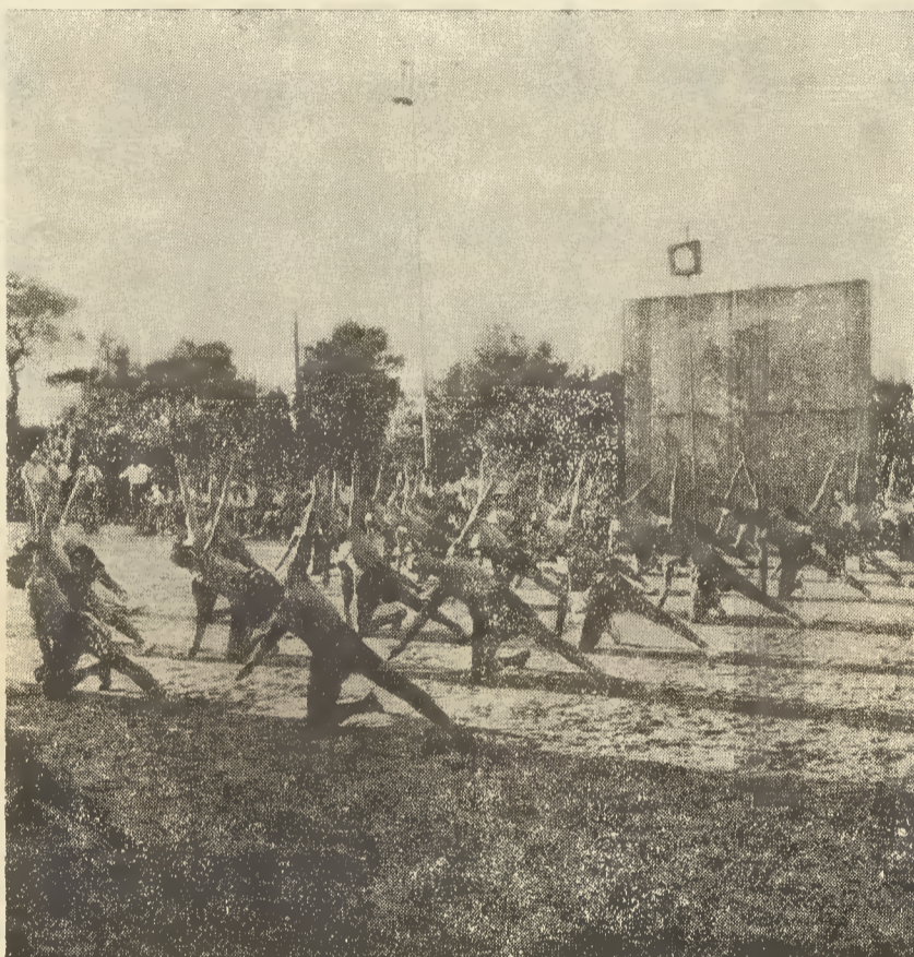
Μία εικόν από τάς γυμναστικάς άσκήσεις των κατασκηνωτών

Δέν πρέπει να παραλείψω να εξάρω έν ιδιαίτερον γεγονός, τό όποιον έν στρέψωμεν τό βλέμμα μας άμέσως διακρίνομεν και του όποίου άλλοτε ή έλλειψις ήτο σημαντική. Πρόκειται περί του Έροΰ Βωμοΰ με τόν φωτεινόν Σταυρόν του, ό όποιος έκπέμπει διαρκώς τάς ακτίνας του και ένσταλάζει την θερμην του εις τάς άπαλάς ψυχάς των παιδιών μας. Ό Έροΰς Βωμός είναι έργον του διακεκριμένου αρχιτέκτονος και πνευματικού καλλιτέχνη κ. Ζουμπολίδη. Τόν ευχαριστούμεν δια την έμπνευσίν του εκ της όποίας έπραγματοποιήθη τό έργον τουτό.