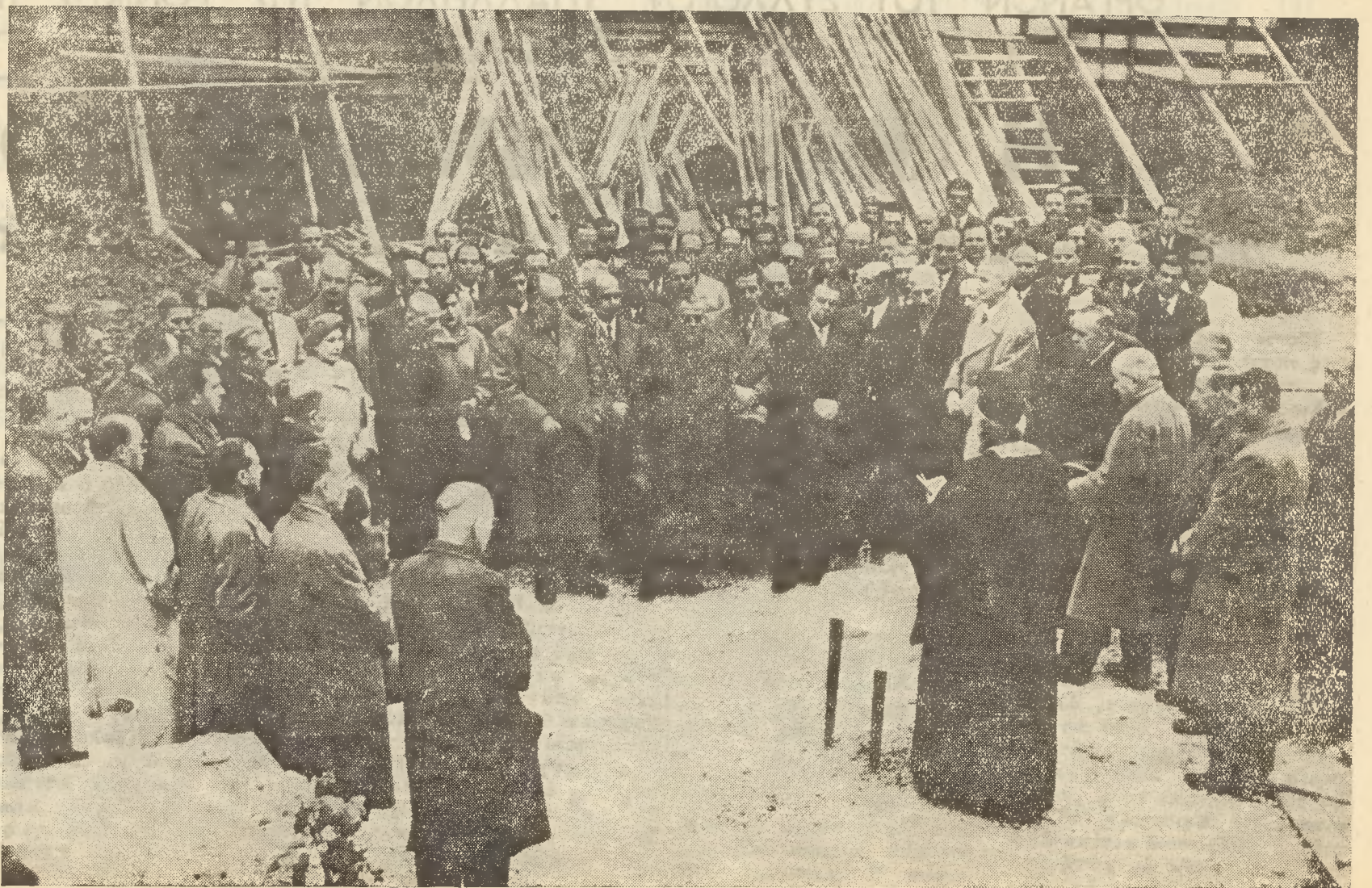
Οί κ. κ. Διοικηταί και Υποδιοικηταί των τριών Τραπεζών, και τά Συμβούλια των Συλλόγων των Υπαλλήλων και Συνταξιούχων των τριών Τραπεζών παρακολουθούν τήν τελετήν τής καταθέσεως του θεμελίου λίθου του Μεγάρου

Η προσπάθεια αύτη χρονικώς σκοπούμενη έχει τήν άρχήν τής εις τήν προπολεμικήν εποχήν. Έδώ είμα, ύποχρεωμένος νά μνησθώ του μακαρίτου Διοικητού Ίω. Δροσοπούλου, επί τής προεδρίας και τή έπιμονή του οποίου ήγοράσθη ό χώρος αυτός. Άλλά ή προσπάθεια αύτη άνεκτήτη λόγω του πολέ-