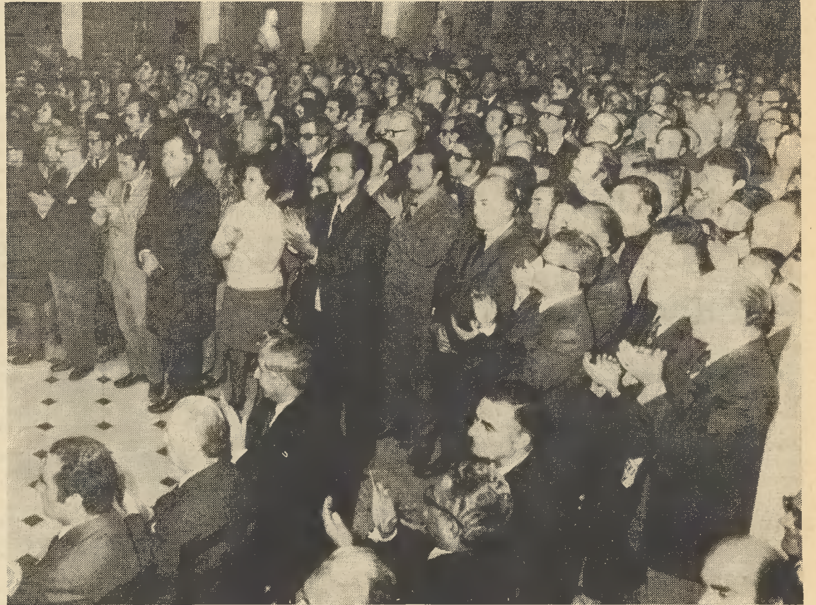
Μία νέα περίοδος εις τας σχέσεις Διοικήσεως και Προσωπικού τής Έθνικης Τραπέζης ήρχισε με την εξαγγελίαν τής ίσης μεταχειρίσεως. Το Προσωπικόν τής Έθνικης Τραπέζης, υπεδέχθη την εξαγγελίαν τής ίσης μεταχειρίσεως από τον κ. Πρωθυπουργόν με χειροκροτήματα και με χειροκροτήματα ηχοορίστησε τον Διοικητήν τής Τραπέζης μας, κ. Χρ. Αχήν.