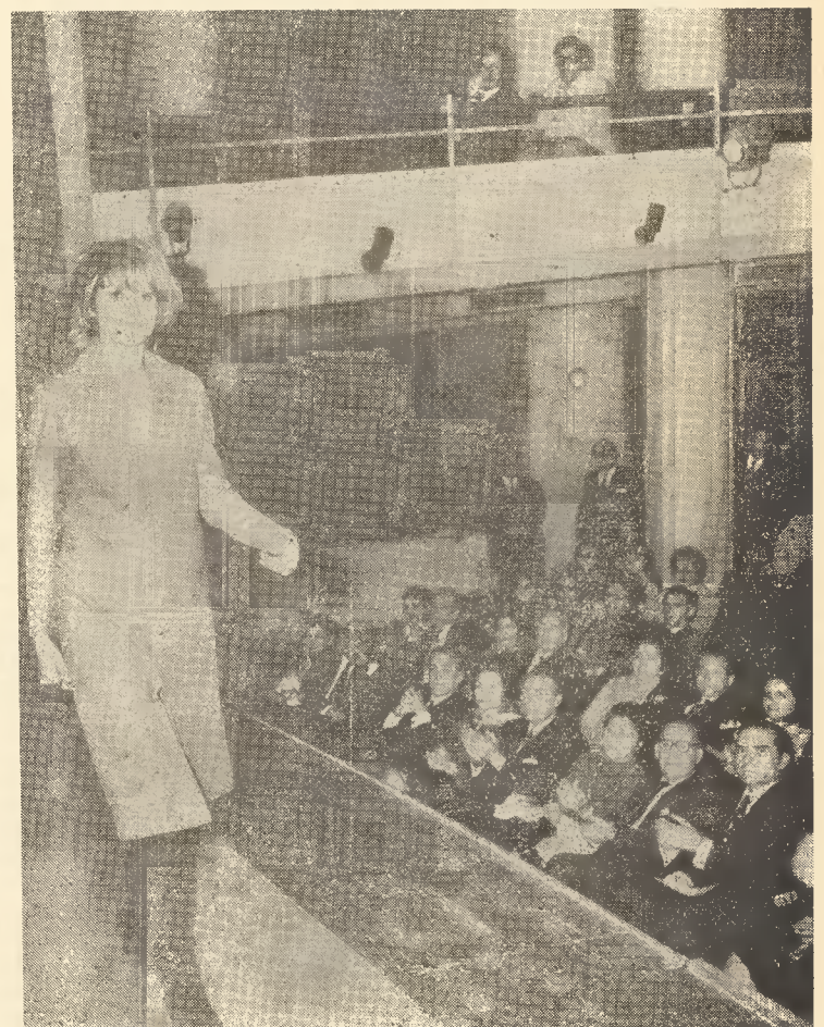
Κατὰ τὴν ἐορτὴν τῆς πίττας τοῦ Προμηθευτικῶ Συνηταιρισμοῦ μας, ἐγένετο καὶ ἐπίδειξις μοντέλλων διαφόρων οἴκων, συνεργαζομένων μετὰ τοῦ Συνηταιρισμοῦ.