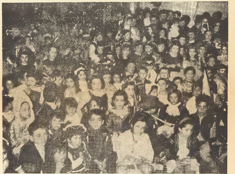
Εἰς τὴν αἴθουσαν τοῦ Ξενοδοχείου «Ἀστὴρ» Βουλιαγμένης ἐδόθη ὁ παιδικὸς χορὸς τοῦ Συλλόγου μας. Οἱ μικροὶ μας φίλοι συναντήθηκαν καὶ πάλι μετὰ ἕνα χρόνον γιὰ νὰ δισκεδάσουν καὶ νὰ ἀνανεώσουν τὴν γνωριμία τους. Συγκεντρωμένοι, παρακολουθοῦν τὸν γελοιοποιὸν καὶ ἐκφράζουν ὁ καθένας με τὸν τρόπο του τὰ συναίσθημά του.