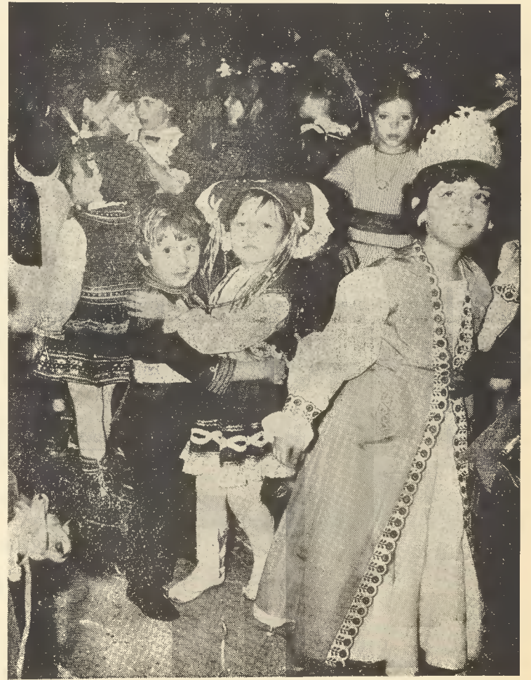
Ζοῦν τὸν δῖκόν τους κόσμον καὶ ἀπολαμβάνουν τὸ μεγαλεῖον τῆς παιδικῆς φαντασίας. Εἶναι δύο «μεγᾶλοι» ποῦ δισκεδάσουν. Ποιὸς μπορεῖ νὰ τοὺς ἀρνήθῃ αὐτὸ ποῦ αἰσθάνονται τὴν ὥρα ποῦ ὁ φωτογραφικὸς φακὸς ἀποθαντίζει τὴν σκηνή; Χαρεῖτε καὶ σεῖς τὴν δική τους χαρὰ.