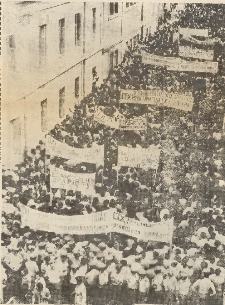
Στιγμιότυπο ἀπ' τή μεγαλειώδη συγκέντρωση ἐξω ἀπό τά γραφεῖα τῆς Ο.Τ.Ο.Ε.

Οἱ ἴδιο κύκλοι ὑπενηθύμιζαν ὅτι λίγες μέρες πρὶν ἀπό τήν ὁμιλία τοῦ κ. Ἀποστολάτου, ἄλλος ὑπουργός τῆς Κυβερνήσεως (ὁ κ. Μπιστοτάκης) δήλωνε στούς δημοσιογράφους ὅτι «καμία σκέψη τῆς κυβερνήσεως δέν ὑπάρχει γιά ἄλλα μέτρα — καί κυρίως γιά τό ἀσφαλιστικό — πού θά θίγουν κεκτημένα δικαιώματα τῶν τραπεζικῶν ὑπαλλήλων».