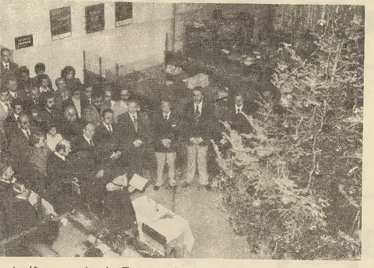
Η Διεύθυνση και το Προσωπικό του Υποκαταστήματος Μητροπόλεως στο καθιερωμένο έτησιο άγιασμό για τόν καινούργιο χρόνο. Τόν άγιασμό έτέλεσε ιερεύς τής Ίεράς Μητροπόλεως.