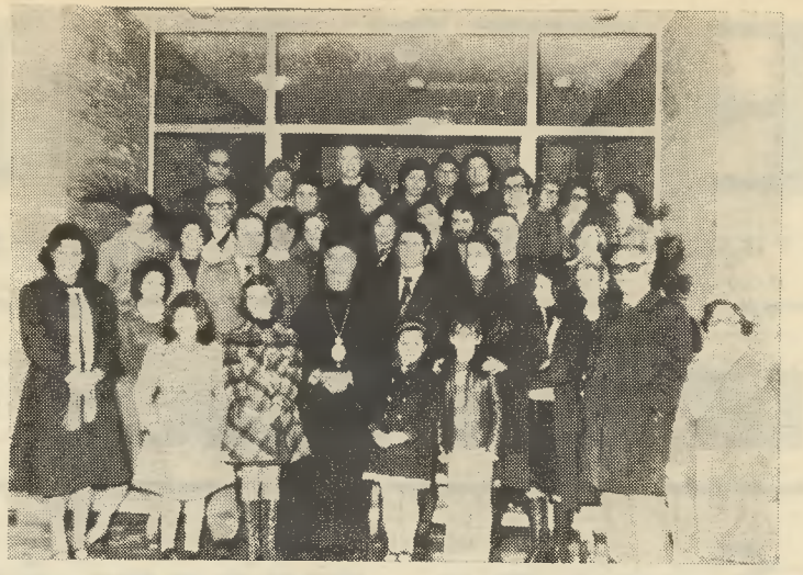
Οι έκδρομείς τής ΕΦΕΤ στην Κύπρο συνοδευόμενοι από τόν πρόεδρο της κ. Έμ. Λίτινα και τόν κ. Βασ. Ζερβουδάκη μέλος του Διοικ. Συμβουλίου του Συλλόγου μας μετέφεραν στον Πρόεδρο Μακάριο τόν άγωνιστικό χαιρετισμό του Προσωπικού τής Εθνικής Τραπεζής. Η ΕΦΕΤ πραγματοποιεί και δεύτερη έκδρομή στην Κύπρο στις 29.2.76.