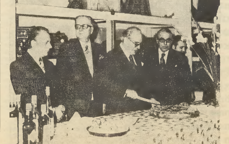
Ο κ. Διοικητής έκοψε τήν πίττα τού Προμηθευτικού και Πιστωτικού Συνεταιρισμού ύπαλλήλων ΕΤΕ, ΕΚΤΕ, ΕΤΒΑ.