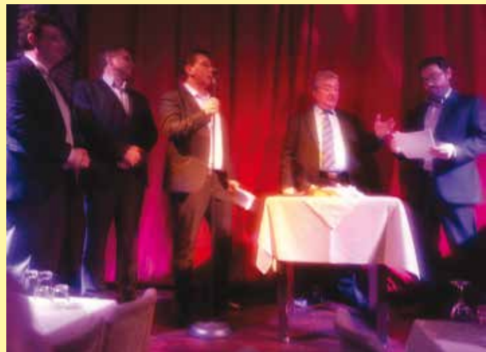
Νομαρχιακό Παράρτημα Αχαΐας

Σημαντική ήταν και η μέριμνα του Γ.Β.Ε. για την ενίσχυση της ομάδας μπάσκετ του Σ.Υ.Ε.Τ.Ε. η οποία συμμετέχει στο πρωτάθλημα που διοργανώνει το Ε.Κ.Θ.