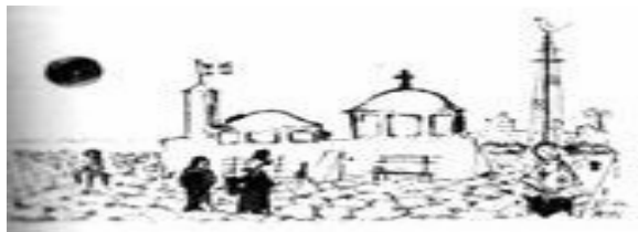
Ο Άγιος Νικόλαος, στο λιμάνι. (Έργο Μίνωος Αργυράκης)